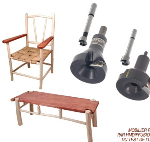
MOBILIER REALISE PAR HMDIFFUSION LORS DU TEST DE L'USINAGE

Découvrez ce mode de fabrication ludique, accessible à tous (même aux enfants !) pour des créations d'allure rustique ou très contemporaine. La matière première : c'est lors de vos promenades dans les bois que vous la trouverez ! À partir de simples branches et sans matériel lourd vous créez chaises, bancs, portails et barrières, jeux d'extérieur, jardinières, etc. Aucune machine "lourde" n'est nécessaire, une simple scie à main, un vilebrequin ou une perceuse, un embout à tenonner et la mèche correspondante : le tour est joué !